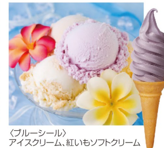
〈ブルーシール〉 アイスクリーム、 紅いもソフトクリーム