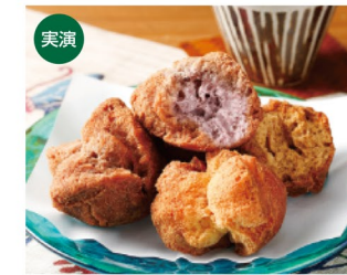
〈三矢本舗〉 三矢サーターアングギー